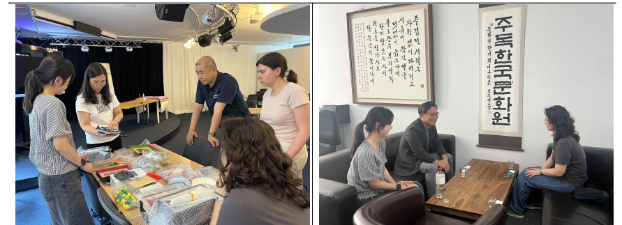
▲ 주독일한국문화원 관계자 업무협의