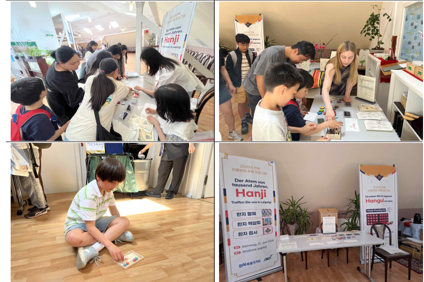
▲ 한글 스탬프 활용한 한지 엽서 만들기, 한지 공기놀이 체험 부스