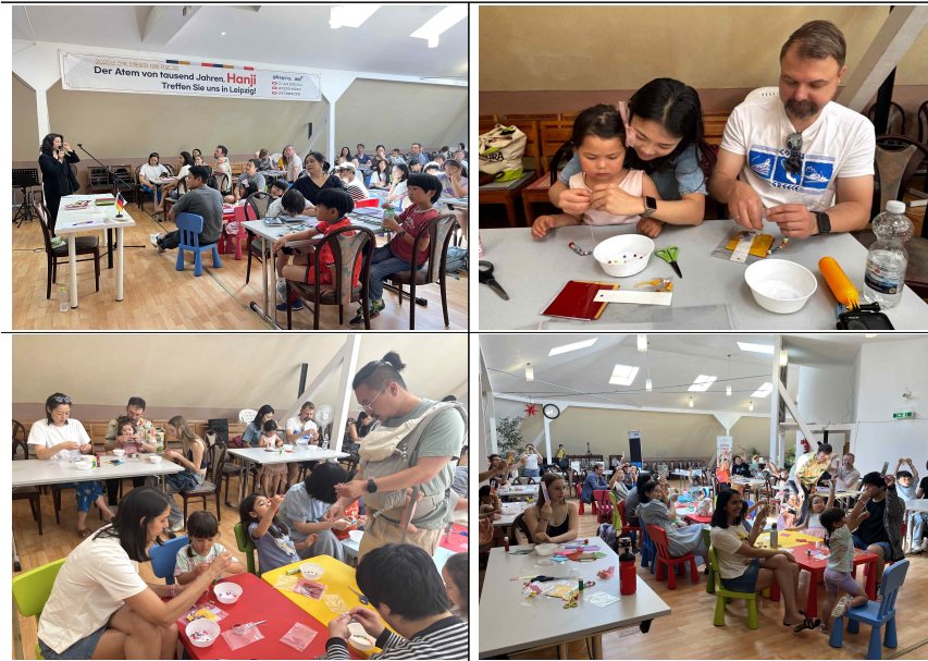
▲ (1차) 한지 팔찌·책갈피 만들기 체험