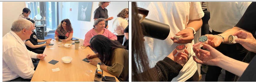
▲ (2차) 한지 자개톡 만들기 체험