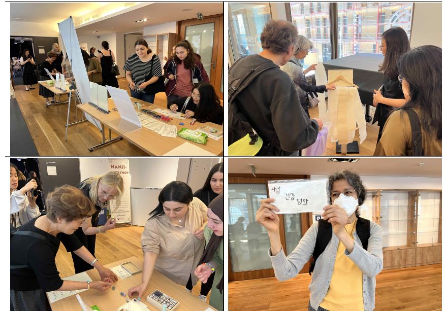
▲ 한글 스탬프 활용한 한지 엽서 만들기, 한지 공기놀이 체험 부스