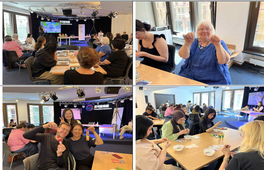
▲ (1차) 한지 팔찌·책갈피 만들기 체험