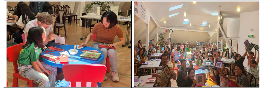
▲ (2차) 한지 접시 만들기 체험