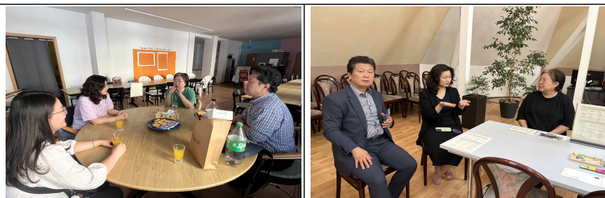
▲ 라이프치히 한인회·한글학교 관계자 업무협의