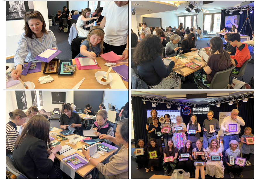
▲ (3차) 한지 접시 만들기 체험