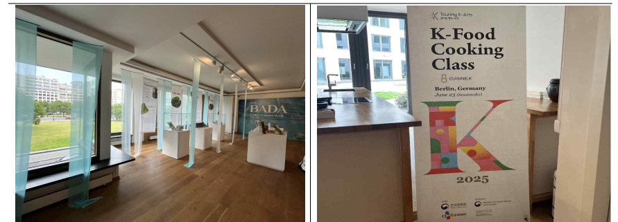
▲ 주독일한국문화원 개최 행사 현황 파악 및 벤치마킹